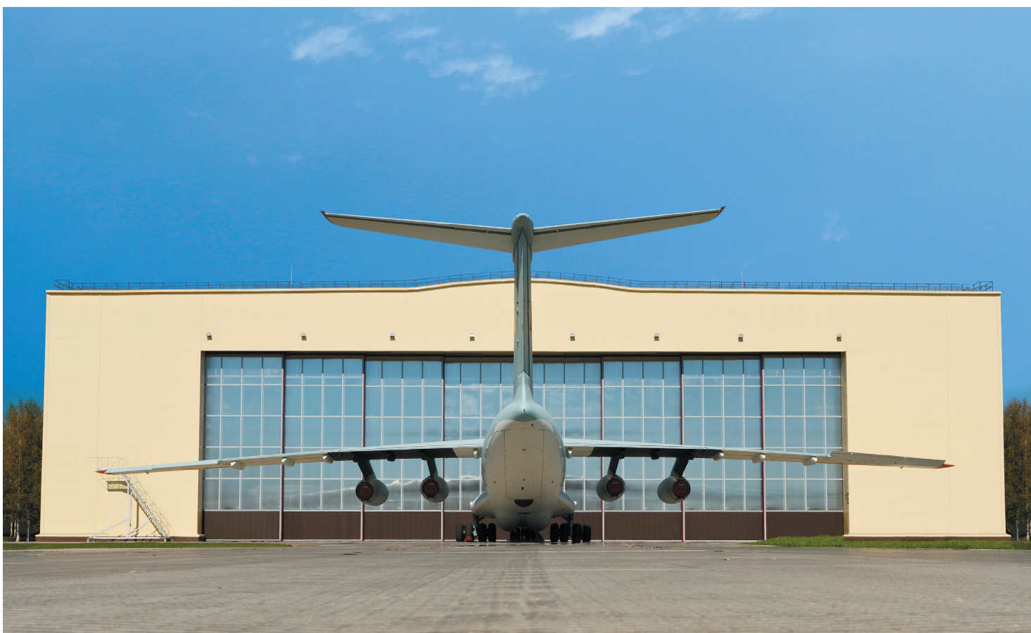
РОССИЯ, СТАРАЯ РУССА