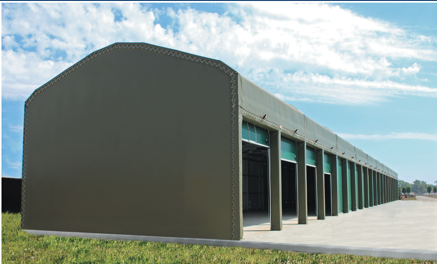
РОССИЯ, МОСКОВСКАЯ ОБЛАСТЬ