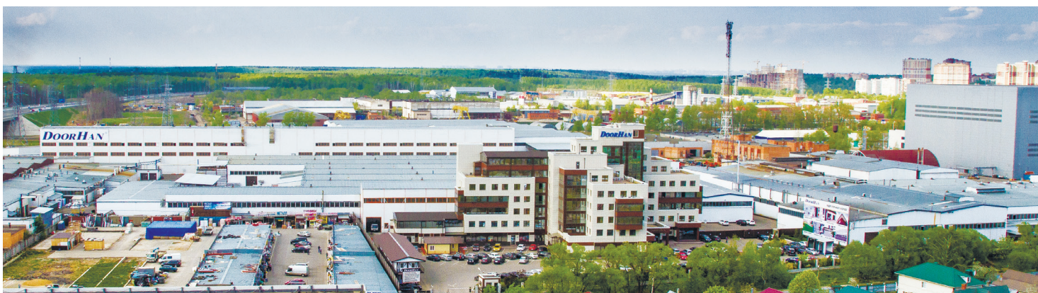
РОССИЯ, МОСКОВСКАЯ ОБЛАСТЬ. Главный производственный и распределительный центр ГК DoorHan

Группа компаний DoorHan — это российский производитель подвижных и неподвижных ограждающих конструкций, перегрузочного оборудования, специальных ворот и дверей для складских и промышленных комплексов, полнокомплектных и быстровозводимых зданий, алюминиевых архитектурных систем, теплоизоляционных материалов и строительных сэндвич-панелей, решений для городской инфраструктуры.