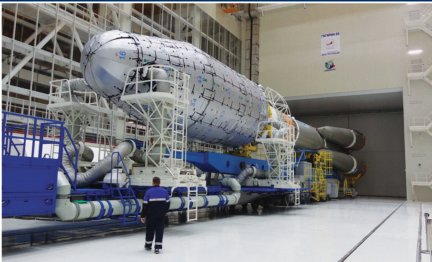
РОССИЯ, АМУРСКАЯ ОБЛАСТЬ