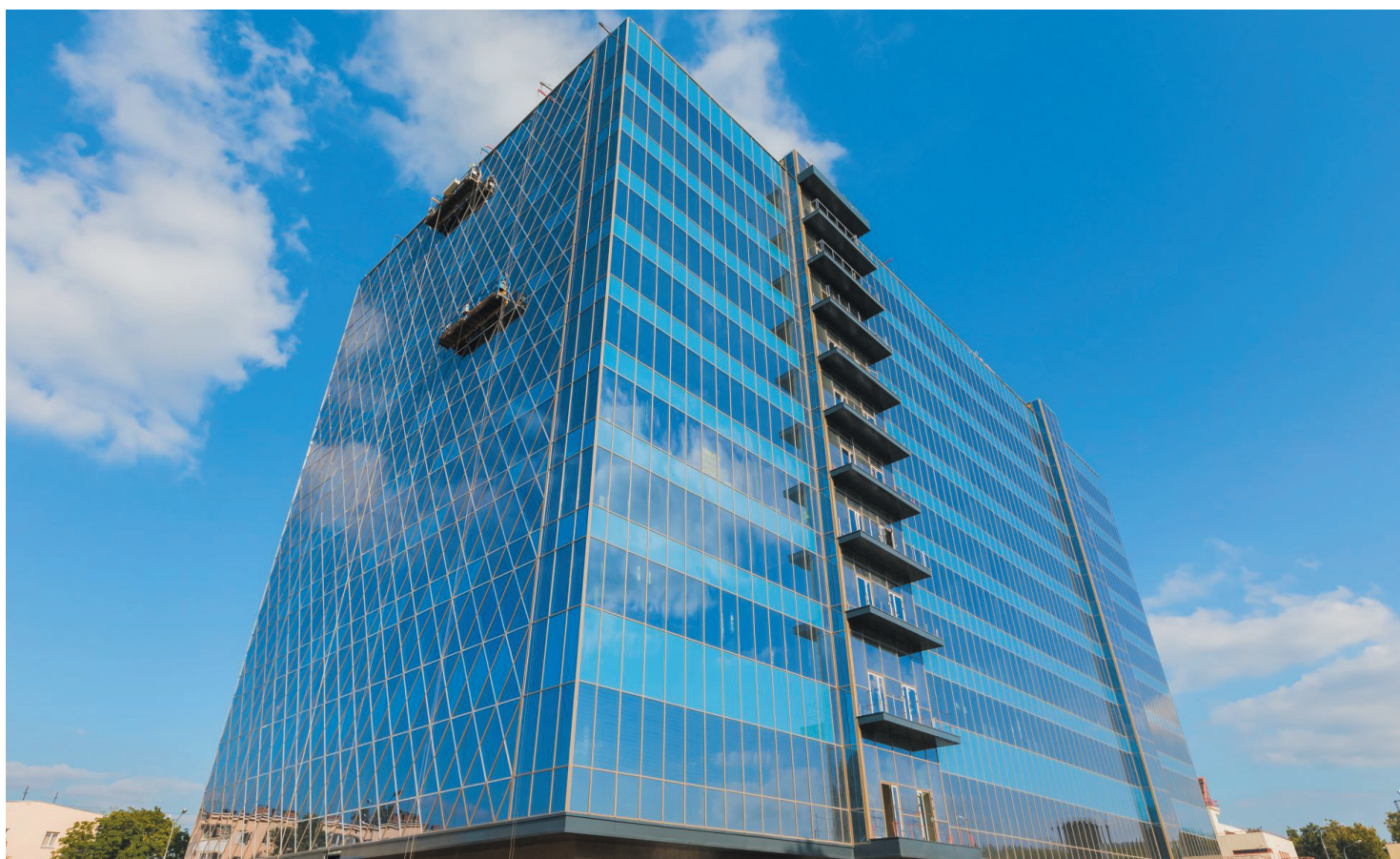
РОССИЯ, МОСКОВСКАЯ ОБЛАСТЬ